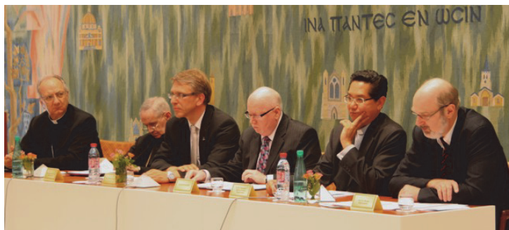
Plenum während der Veröffentlichung des Verhaltenskodexes

Geoff Tunnicliffe, der Generalsekretär der Weltweiten Evangelischen Allianz (WEA), wies darauf hin, dass in dem vorgelegten Dokument alle vier Hauptanliegen, die die WEA seit ihrer Gründung 1846 vertritt, eine tragende Rolle spielen: 1. Einheit in Christus, 2. Menschenrechte, 3. Evangelisation, 4. Religionsfreiheit. Der Generalsekretär der WEA sprach von einem „kraftvollen Dokument“, nicht zuletzt, weil durch die Vertreter der verschiedenen Organisationen 90 Prozent der Weltchristenheit