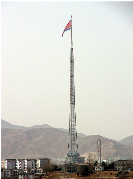
Fahnenmast in Kijöng-dong

Wie stehen sie zu den kilometerweit sichtbaren Weihnachtsbaumkonstruktionen auf südkoreanischer Seite.