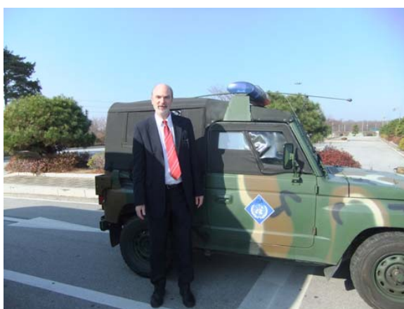
Schirmmacher mit UN-Fahrzeug der Delegation

(Bonn, 15.12.2011) Eine Delegation der Weltweiten Evangelischen Allianz unter Leitung ihres Generalsekretärs Geoff Tunnicliffe besuchte auf Vermittlung des südkoreanischen Verteidigungsministeriums die demilitarisierte Zone zwischen Nord- und Südkorea. Offiziere der dort stationierten UN-Truppen des Joint Security Areas (JSA) berichteten vor Ort über die angespannte Lage. Auf einem militärischen Aussichtsturm führten sie in die angespannte Propagandalage ein, da beide Länder durch überdimensionierte Fahnenmaste und andere Aktivitäten auf sich aufmerksam machten. Am Tisch der Baracke, wo 1953 das Waffenstillstandsabkommen auf der Demarkationslinie unterzeichnet wurde, wurde die Aufgabe der Waffenstillstandskommission MAC dargestellt. Es ist auch der einzige Ort, wo man die Grenze zwischen Süd- und Nordkorea überschreiten kann.