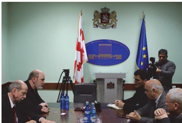
Empfang durch die Exilregierung Abchasiens, vorne rechts der Präsident, der Präsident des Parlamentes und der Präsident des Obersten Gerichtshofes

Ebenso halten die Palästinenserflüchtlinge die Welt seit Jahrzehnten in Atem, die etwa 200.000 Flüchtlinge aus Abchasien, die seit 1993 in Georgien leben und in ihre Heimat zurückkehren möchten, hätten dagegen keine Stimme – außer in der Exil-Regierung. Unter den 1993 in Abchasien verbliebenen Georgiern kam es zu ethnischen Säuberungen, die im Massaker von Sochumi gipfelten, als die Einwohner des Ortes zunächst gefoltert, vergewaltigt und angezündet und am Ende etwa 7.000 Menschen grausam umgebracht wurden, darunter der Regierungschef des Landes. Die OSZE hat die ethnischen Säuberungen gegen Georgier in Abchasien offiziell