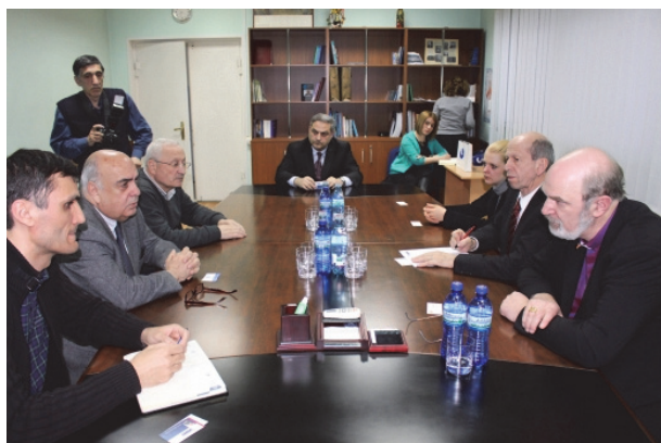
Blick vom Kopf des Regierungstisches Abchasiens, am Ende der Präsident der IGFM Georgien, Avtandil Davitaia

anerkannt und verurteilt. Bislang wurde noch kein Teilnehmer an den Massakern vor Gericht gestellt.