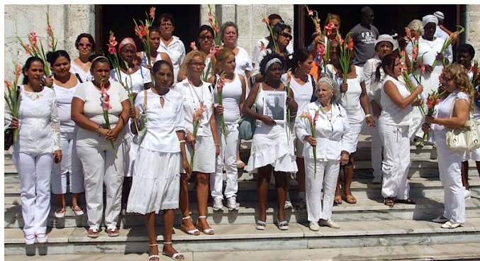
Die „Damen in Weiß“