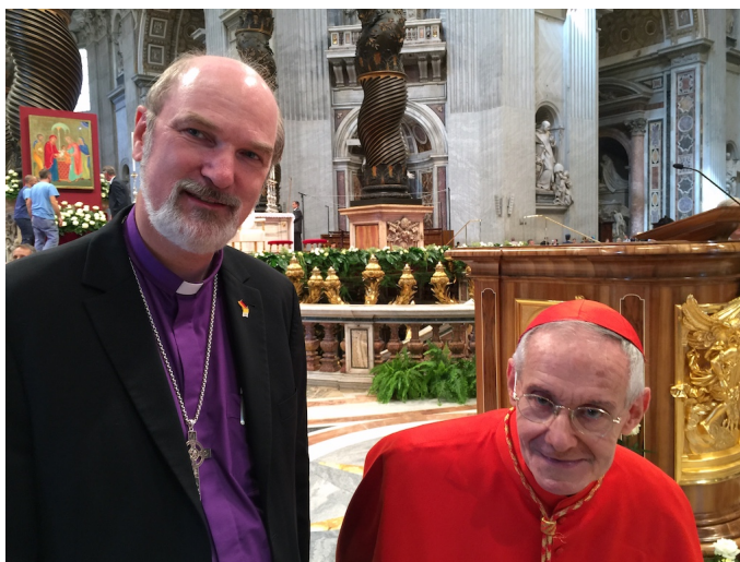
Mit Kardinal Tauran beim Eröffnungsgottesdienst der zweiten Vatikansynode zur Ehe (2015)

Im April 2018 besuchte Tauran die saudi-arabische Hauptstadt Riad und traf sich mit verschiedenen hochrangigen muslimischen Führungspersonlichkeiten. Trotz eines Verbotes einer nicht-islamischen Religionsausübung in Saudi-Arabien feierte er eine Messe mit der örtlichen katholischen Gemeinde. Er rief Christen und Muslime auf, ein