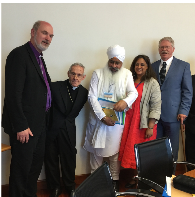
Immer mittendrin, bis zuletzt: Kardinal Tauran im Gespräch mit Vertretern nichtchristlicher Religionen

Vor allem traf ich Kardinal Tauran bei der Amtseinssetzung des Papstes wieder. Schon nach kurzer Zeit war klar, dass die Verkündigung seines Namens nicht die einzige Verbindung zwischen dem Kardinal und dem neuen Papst bleiben würde. Vielmehr hatten sich hier zwei Gleichgesinnte gefunden. Franziskus bestätigte Tauran als einen der Ersten in seinem Amt, obwohl er schon schwer von seiner Parkinsonerkrankung gekennzeichnet war und nur unter äußerster Disziplin seinen Aufgaben nachkam. Der Kardinal genoss bis zum Schluss das höchste Vertrauen des Papstes.