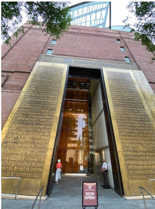
Der Eingang des Bibelmuseums