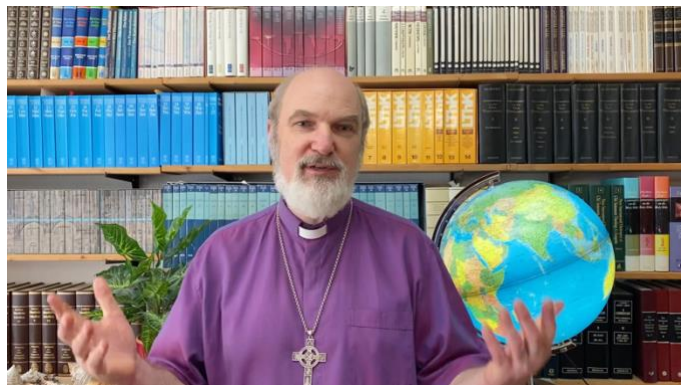
Thomas Schirmmacher während seines Videogrüßworts, in dem er ermutigte und auf eine relevante, angemessene und zugängliche Ausbildung für das ganze Volk Gottes und den Platz des TEE in dieser herausfordernden Aufgabe hinwies

(Bonn, 14.12.2021) Ein neu erschienenes Buch über Theologische Ausbildung durch Weiterbildung (TEE) bietet globale Perspektiven zur Wirksamkeit von TEE als Antwort auf die Ausbildungsbedürfnisse der heutigen Kirche und zeigt auch die Anpassungsfähigkeit des Modells an unterschiedliche Kontexte in verschiedenen Teilen der Welt. Bei einer kürzlich erfolgten digitalen Buchvorstellung lobten führende Vertreter der Weltweiten Evangelischen Allianz (WEA) das Buch „TEE for the 21st Century: Tools to Equip and Empower God's People for His Mission“ als wertvolle Ressource mit Forschungsergebnissen und Geschichten, die Einblicke in die effektive Anwendung des TEE bei der Ausbildung der schnell wachsenden Zahl von Kirchenleitern heute geben.