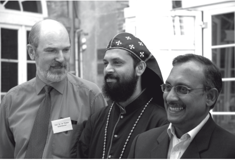
Teilnehmer der Konsultation aus Deutschland, Indien und Malaysia.

politische Gewalt, indem Eltern ihre Kinder geraubt werden oder indem über den eigenen Glauben gelogen wird. Von uns aus gesehen sind dies universelle Prinzipien, und dieses Regelwerk sollte sich nicht allein gegen Evangelikale und Pfingstler (die einen Zweig des Evangelikalismus darstellen) richten. Zumal Evangelikale/Pfingstler einen großen Teil der christlichen Mission leisten, werden wir nur