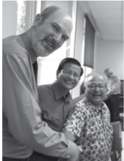
Der Erzbischof von Myanmar und der Apostolische Nuntius von Nepal bedanken sich für das regelmäßige Gebet für ihre Länder.

Gemäß 1. Petrus 3 sprechen Menschen nicht direkt mit Gott, wenn sie mit uns sprechen. Einerseits können wir durchaus Gottes Botschafter sein und Zeugnis ablegen über die Hoffnung, die in uns ist. Doch andererseits sind wir auch nur Menschen, die nicht durch unsere eigene Tugendhaftigkeit, sondern allein durch die Gnade Gottes gerettet sind. Wir wollen, dass Menschen