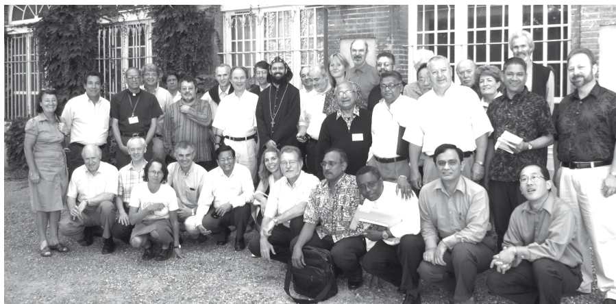
Die Teilnehmer der Konsultation.

hungen zu anderen Religionen zu dessen Einhaltung zu verpflichten. Wenn nicht einmal Christen in der Lage sind, einen friedlichen Weg zu finden, untereinander zu missionieren, und zwar auf eine Weise, die die Würde und Rechte anderer Menschen respektiert, wie sollte das dann unter den verschiedenen Religionen zu machen sein?